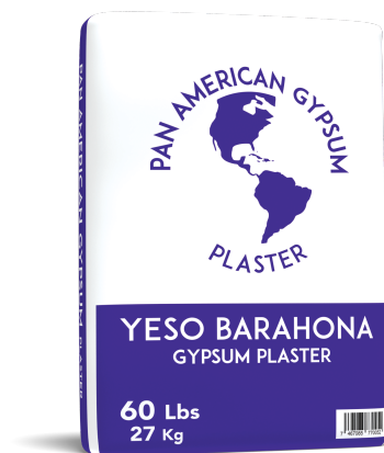
YESO TIPO A (UNE-EN 13279-1)